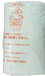
吸水シート付き 専用袋 × 3