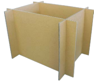
井型用仕切り板 大 × 2、小 × 2