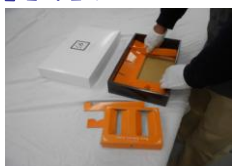
化粧箱の折り込み