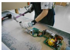
パチスロ・OA機器の解体