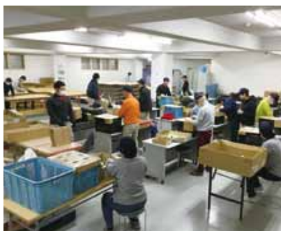
ペットボトルキャップ選別、紙器加工作業

20社以上の企業と提携を結び、多種多様な作業により、利用者さんの就労ニーズに応じた作業種の提供を行います。作業をする事での達成感、充実感、満足感を育み、活気ある生活スタイルを目指します。