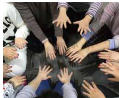
レクリエーションを実施し親交を深めます