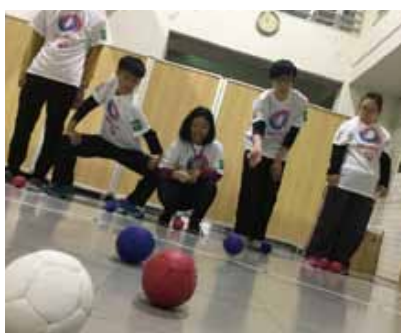
スポーツ練習を通じたコミュニケーション力獲得

体力維持・向上に主眼を置き、スポーツや運動を通じてコミュニケーション力や基本的習慣の獲得を主とした支援を展開します。併せて、作業機会の提供や生活スキルの向上をもって地域就労や地域生活を目指し、スポーツと働くことの両立を支援する事業を有期限で提供します。