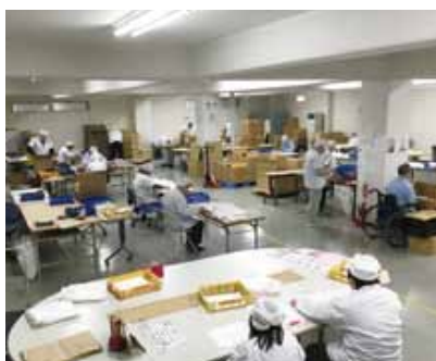
エプロンたみの作業