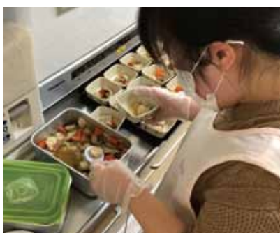
介護施設(グループホーム)での介護実習

2年間の支援プログラムの中で、働くことに必要な講習や作業訓練、及び企業見学や実習等により、一般就労に向けた準備支援を行います。また、就職後のフォローアップも行い、安定した生活が送れるよう支援します。