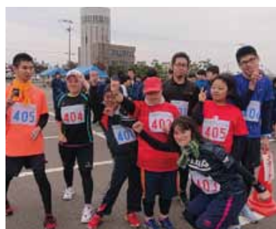
マラソン大会の参加